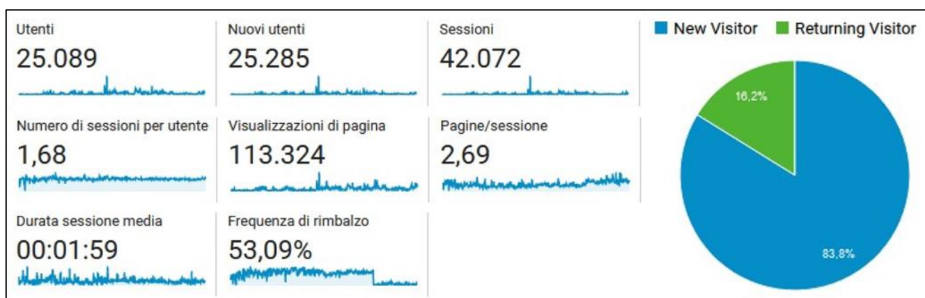
Figura 1: dati utenti e utilizzo del sito web (Google Analytics)

Il 16,2% degli utenti ha utilizzato il sito web più di una volta (Fig.1).