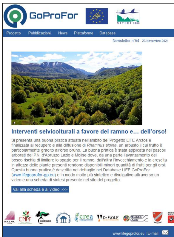
Figura 5: newsletters