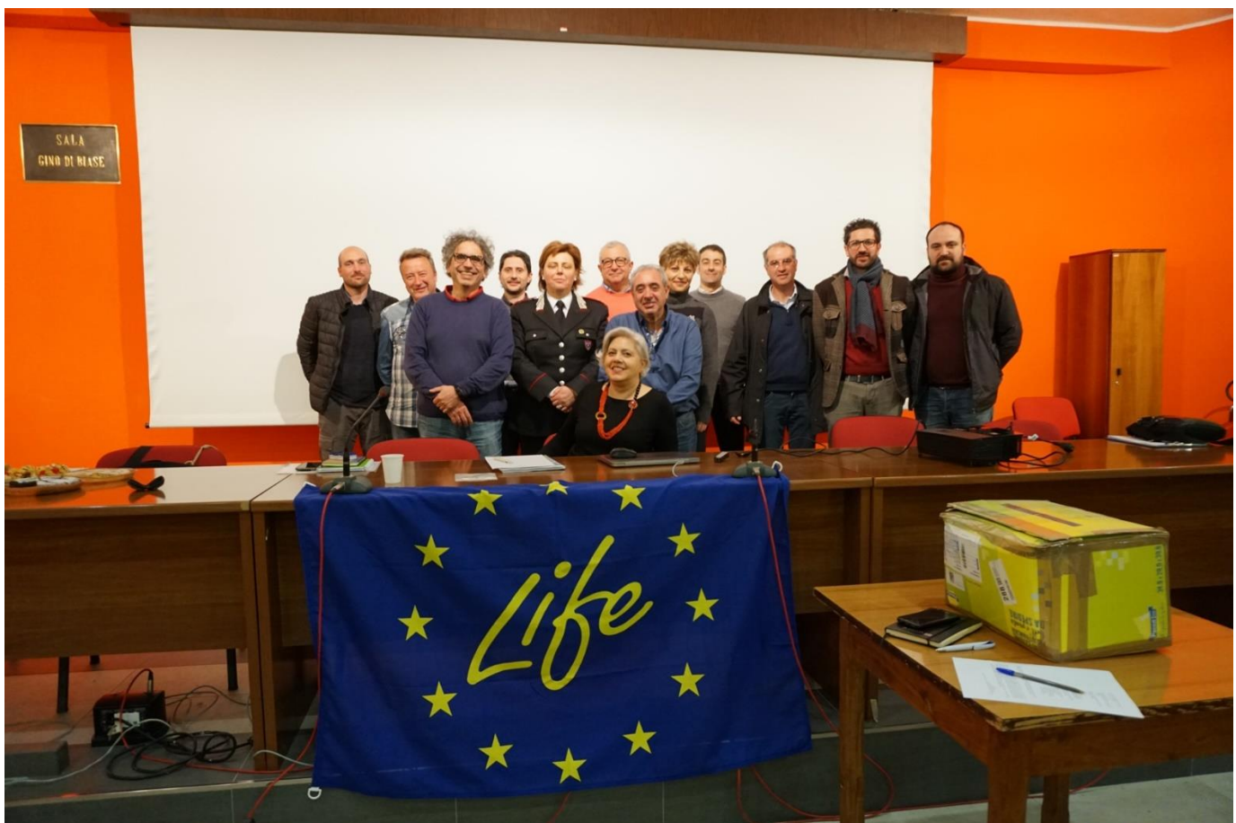
Figura 1: Campobasso, 27.03.2019 - Primo incontro di presentazione del progetto e del laboratorio regionale